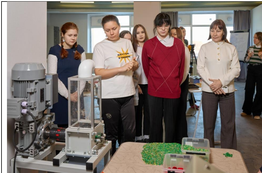
Слева – дробилка для пластика

Фотографии материальных объектов (сооружений, площадок, экспозиций и аналогичных), созданных (восстановленных, приобретенных) с использованием гранта в отчетном периоде (фотографии до, во время и после создания (восстановления) объектов), и (или) видеозаписи их создания (восстановления)