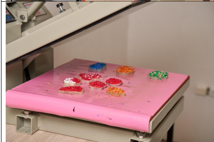
Термопресс для литья брелков методом прямого прессования